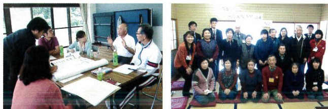
①地域ケア会議の様子