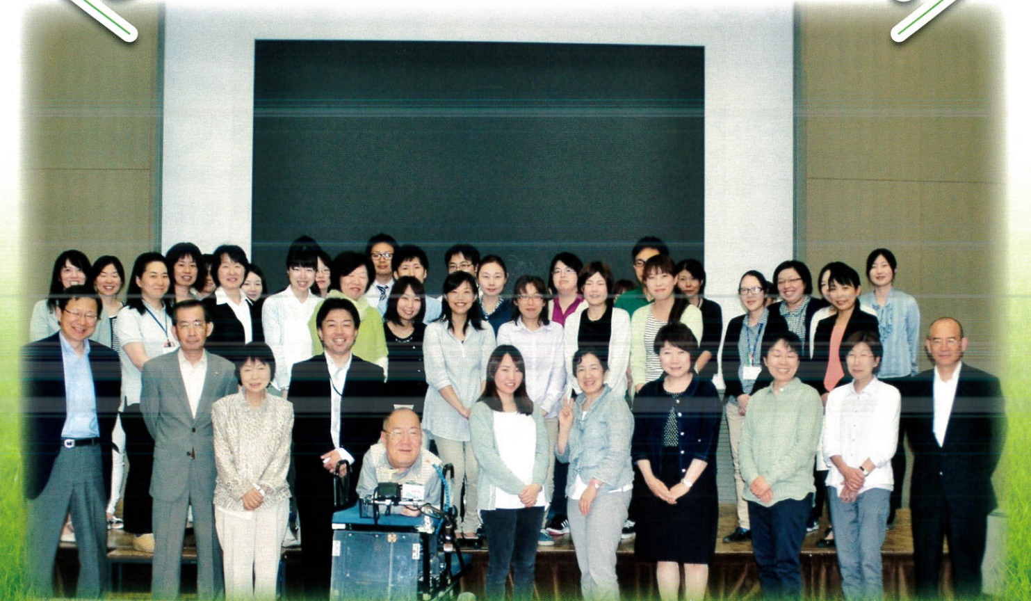
平成27年度 通常総会 法人会員集合写真