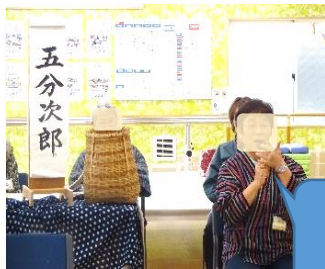
指の腹におった子だもんで 背の高さは五分ぐらいしかない