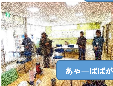
あーばばがこんな赤ん坊になってしまったわー