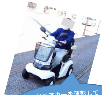
セニアカーを運転して 友達に会いに行きたい