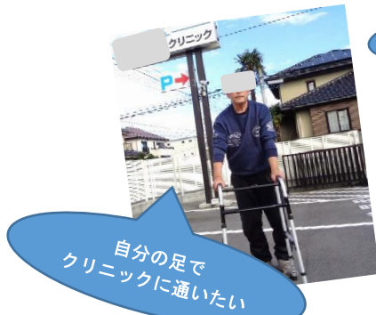
自分の足で クリニックに通いたい