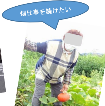
畑仕事を続けたい