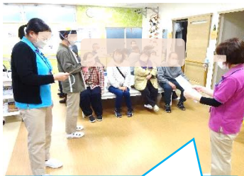
利用者〇名、避難完了しました。