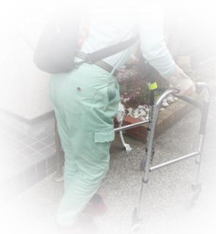
玄関前に停めてある車に向かう