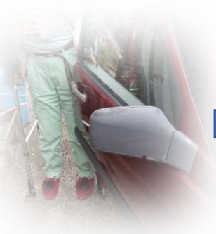
車のドアを開ける