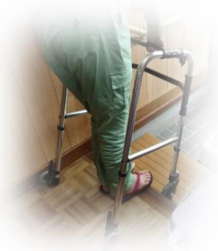
玄関の段差を降りる①