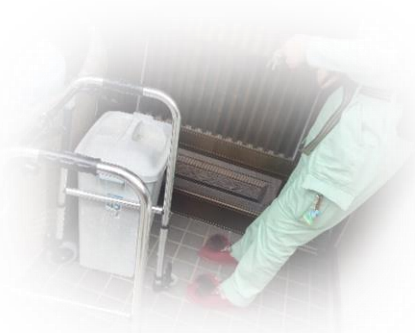
玄関外に出てカギを締める