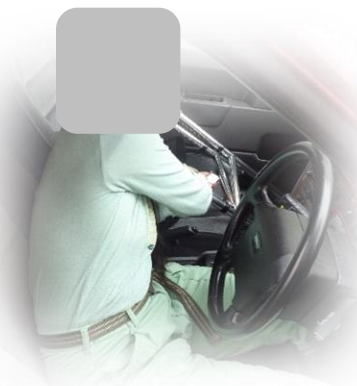
歩行器を助手席に乗せる