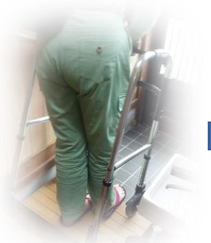
玄関の段差を降りる②