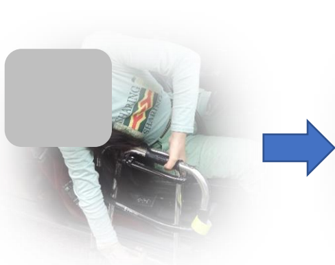
運転席に座り歩行器を持ち上げる