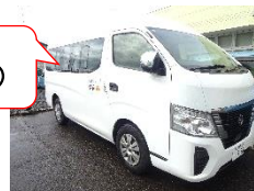
キャラバン1台 （車椅子2台乗れます！）