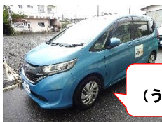
フリード3台 （うち車椅子仕様車2台）